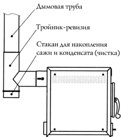
Рис. 4 – Схема присоединения Энергопечи к дымоходу.

Соединять печь с дымоходом рекомендуется через тройник-ревизию (в комплект поставки не входит), оснащенную стаканом для сбора конденсата и сажи (см. рисунок 4).