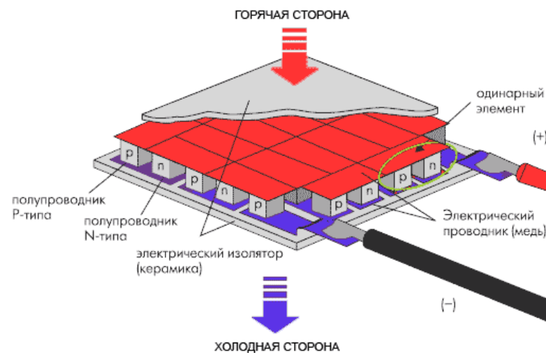
Рис. 2 – Устройство термоэлектрического модуля.